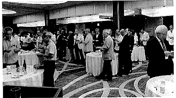
盛り上がる懇親会