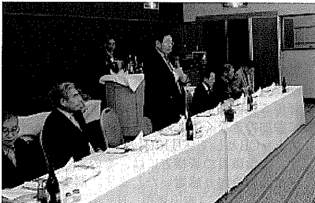
瑞山会役員メンバー