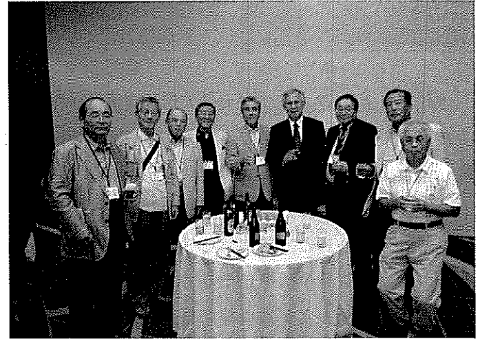
<学長を囲んで一期生>

平成23年度経済学部同窓会通常総会・懇親会が、平成23年9月24日（土）、名古屋駅西口の「名鉄ニューグランドホテル」において開催されました。