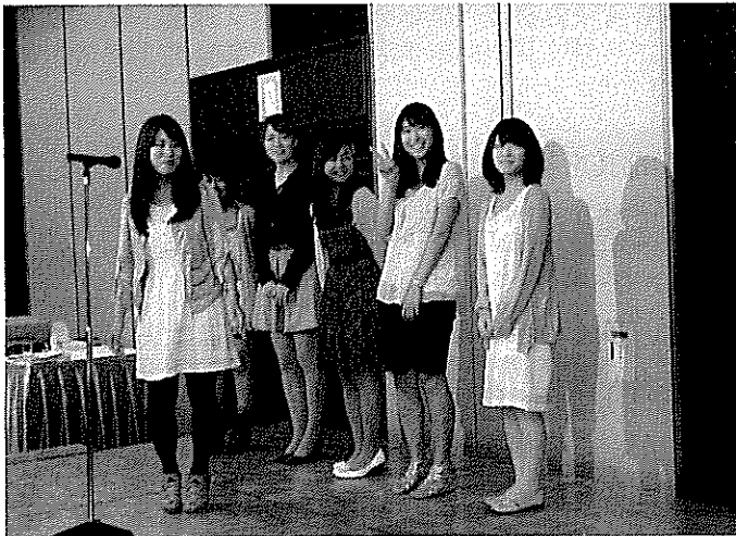
<在学生のスピーチ>