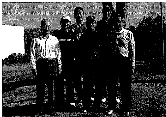
参加者一同で記念写真