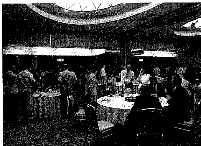
盛り上がった懇親会