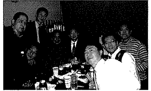
09年歓送・忘年会 2009.12.16(水) 於 名古屋駅前月の雫

学部3名、経済学部1名、との情報の披露があり(その時点ではトヨタ記念病院関係人事は調整中とのこと)新人歓迎を兼ねた平成